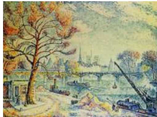
Paul Signac - Paris, le pont des Arts