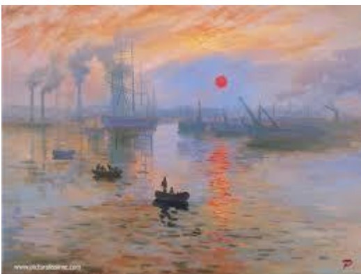
Claude Monet - Impression soleil levant