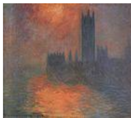
Le parlement de Londres au soleil couchant