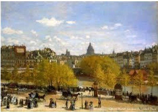
Claude Monet - Le Quai du Louvre

Les élèves pourront être évalués par la réalisation d'un dessin (consigne : Dessinez le paysage décrit par Emile Zola en reprenant tous les éléments du texte, votre dessin devra être conforme à l'atmosphère créée par Zola et au style impressionniste). Le corrigé s'appuiera sur les œuvres ci-dessous.