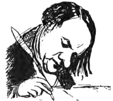
Dessin de Mérimée