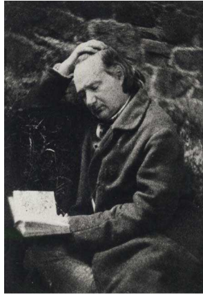
Portrait photographique de Victor Hugo