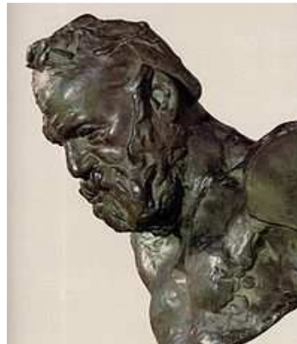
Victor Hugo par Rodin