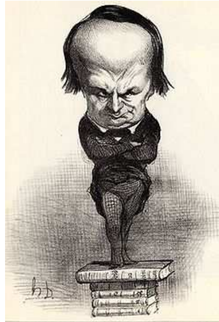
Caricature de Victor Hugo par Daumier, parue dans le Charivari du 20 juillet 1849.