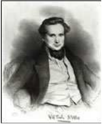
Portrait de Victor Hugo, dessin de Déveria, 1829